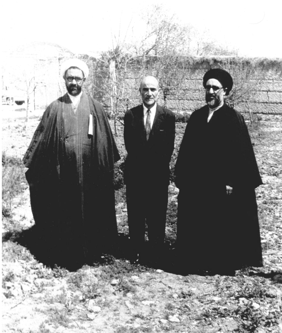
مراسم جشن عید فطر انجمن اسلامی دانشجویان دانشگاه تهران، در گلشهر کرج- سال ۱۳۳۷ (مرحوم آیت الله طالقانی، مرحوم مهندس بازرگان، شهید استاد مطهری)