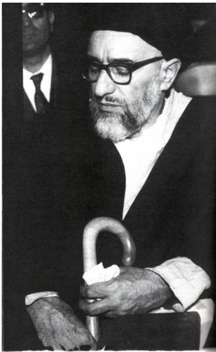
آیت‌الله سید محمود طالقانی در اولین جلسه دادگاه‌عادی ویژه شماره (۱) دادرسی ارتش، مورخ ۱۳۴۲/۷/۲۹