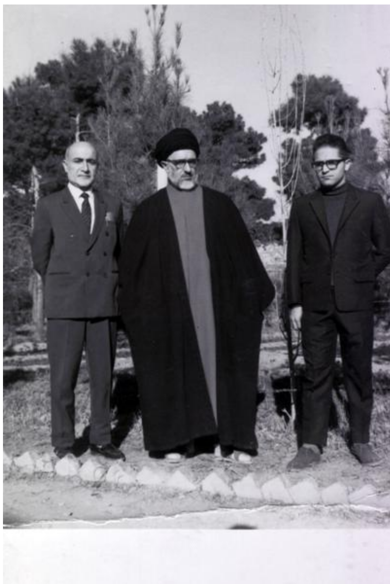
سید مصطفی مفیدی، آیت‌الله سید محمود طالقانی، مهندس مهدی بازرگان ۱۳۴۵/۱۲/۷، باغ زندان قصر