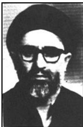
آیت‌الله سید محمود طالقانی ده سال زندان