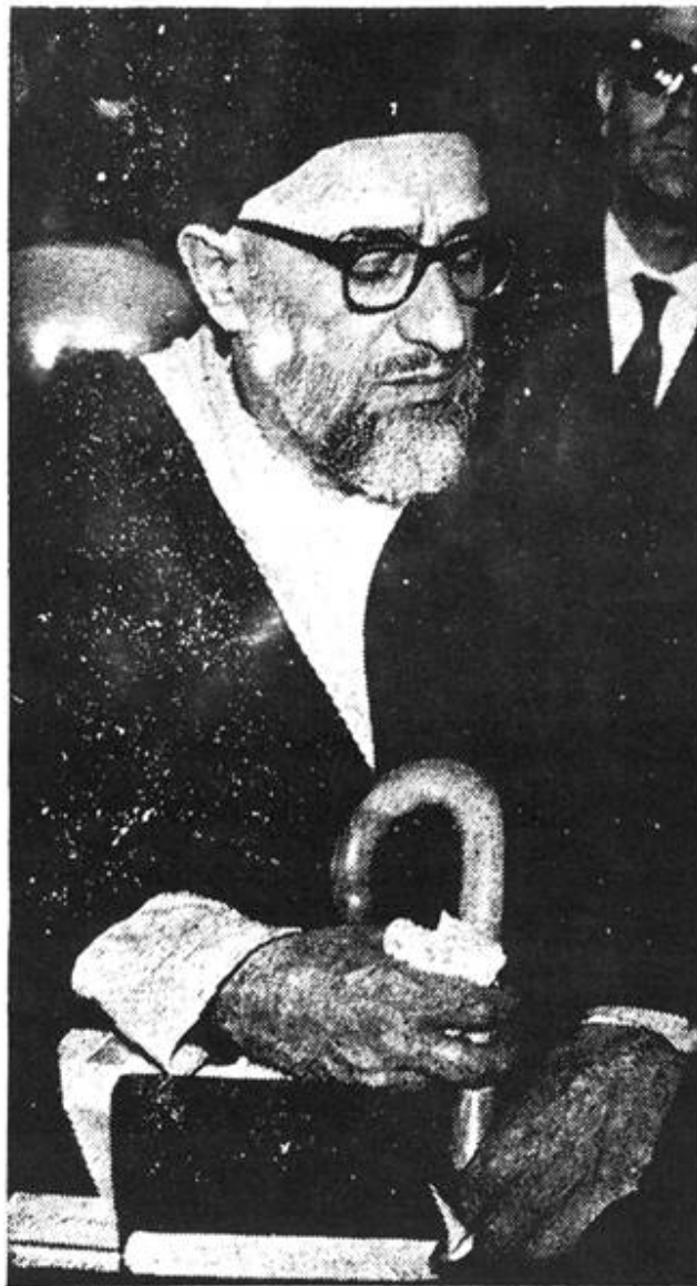
Ayatollah Taleghani (above) and seven others went on trial for treason yesterday. (Complete story on Page 8).