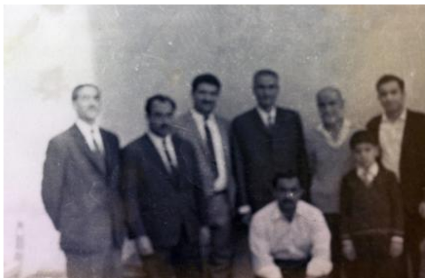
مهندس مهدی بازرگان (نفر دوم ایستاده)، در میان افسران حزب توده و ملاقات کنندگان، فروردین ۱۳۴۵، دژ زندان برازجان