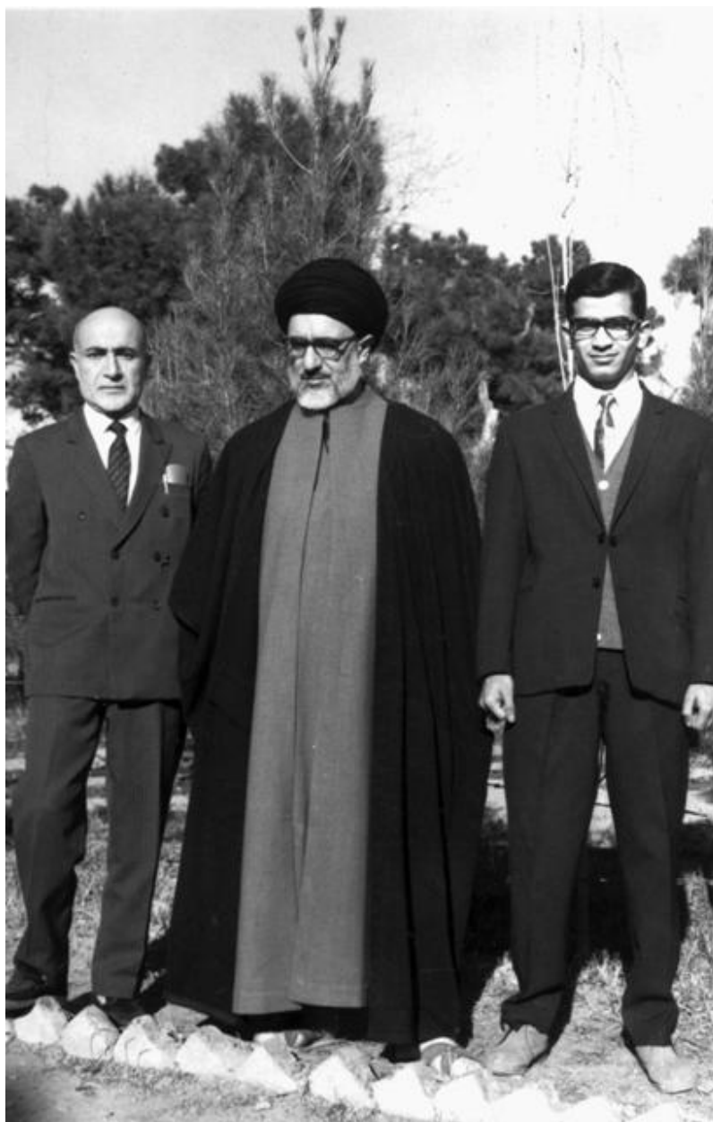
رضا حمسی، آیت‌الله طالقانی، مهندس مهدی بازرگان مورخ ۱۳۴۵/۱۲/۷، باغ زندان قصر