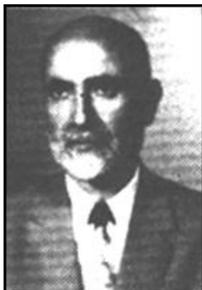
مهندس مهدی بازرگان، استاد دانشگاه ده سال زندان