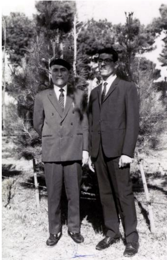
دکتر محمد مهدی جعفری، مهندس مهدی بازرگان - مقابل زندان شماره ۴ قصر زنده‌یاد مهندس بازرگان این عکس را به آقای جعفری داده و نوشته‌اند: «همیشه با هم، در راه حق» مهدی بازرگان