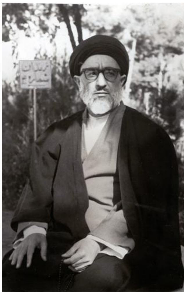
آیت‌الله طالقانی، زندان شماره ۴ قصر، سال ۱۳۴۲