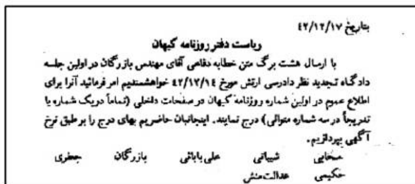
نامه زندانیان به روزنامه کیهان

برای اطلاع خوانندگان و تکمیل این گزارش بریده‌های جراید را که اکثراً فقط خبر تشکیل جلسات دادگاهها و رأی دادگاهها را چاپ کرده‌اند؛ همراه با نامه زندانیان به روزنامه کیهان عیناً درج می‌نماییم.